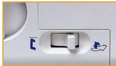
Mühesloses Versenken des Messers mittels Schalter!