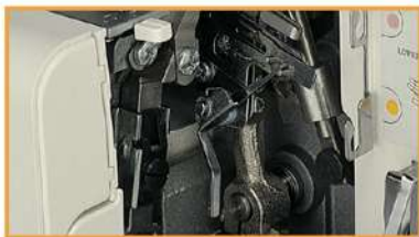
UntergreifereinfÄdelhilfe- ruck-zuck einfÄdeln!